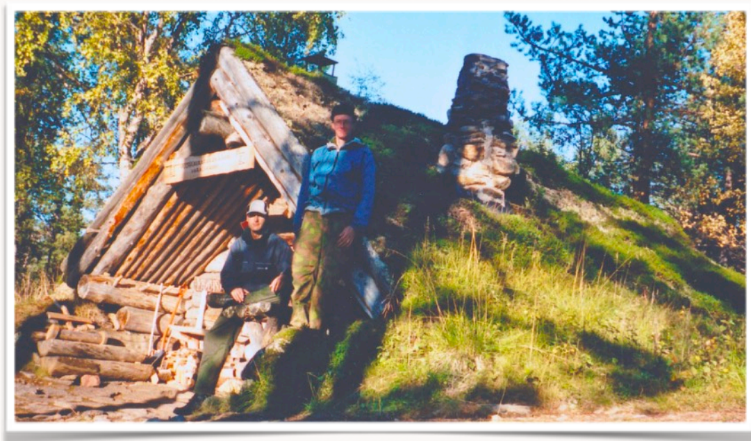
Ihastelimme Imatran Lapinkävijöiden rakentamaa Muorravaarakanruoktua

Aamuvellit poskeen ja reippahasti taas baanalle. Pilvinen päivä vei meitä mutka mutkalta Muorravaarakanjokea ylös. Saavuttuamme kammille siellä olikin kova hyörinä. Ei sinänsä mikään ihme, kun tönöt ovat hienolla paikalla. Vaikka kammi on rakennettu jo vuonna 1953, niin se on edelleen kaunista katseltavaa.